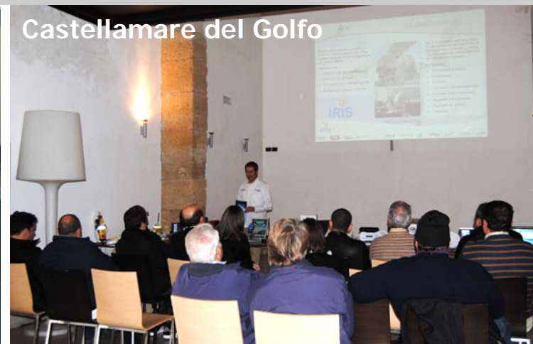
Castellamare del Golfo